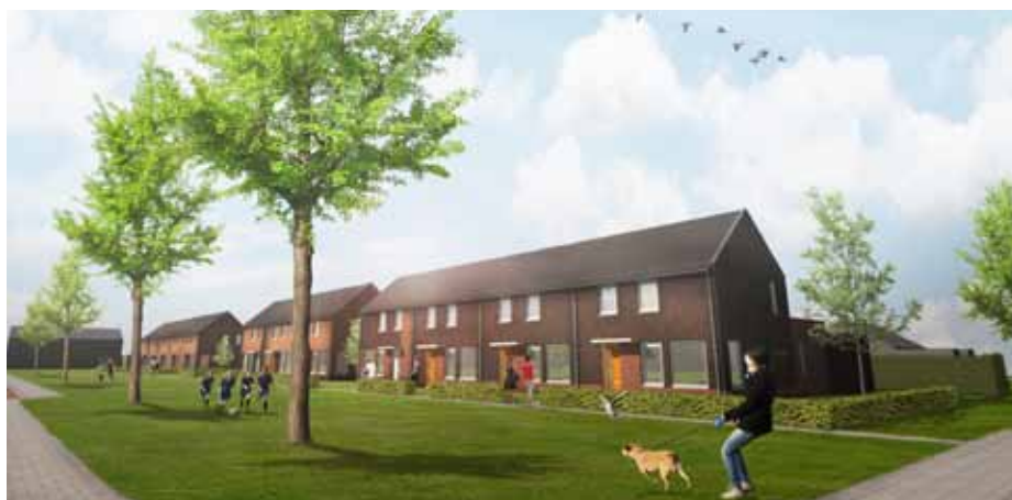
Impressie van de nieuwbouw in Nieuw-Buinen