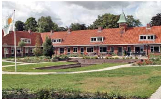
Het Hofje, gebouwd in 1938 voor 'ouden van dagen'.

De groeisput van de jaren zestig had zo zijn nadelen. Stadskanaal telde vrijwel