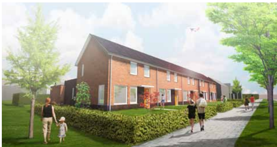
Impressie van de nieuwbouw in Musselkanaal

Met de nieuwbouw op deze locatie wordt de oorspronkelijke lintbebouwing van Musselkanaal versterkt. De bouw start in september 2017 en zal naar verwachting eind 2017 klaar zijn. Deze woningen worden circa 82 m 2 groot en krijgen een huurprijs van maximaal € 525,- per maand.