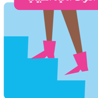
صعود ونزول الدرج